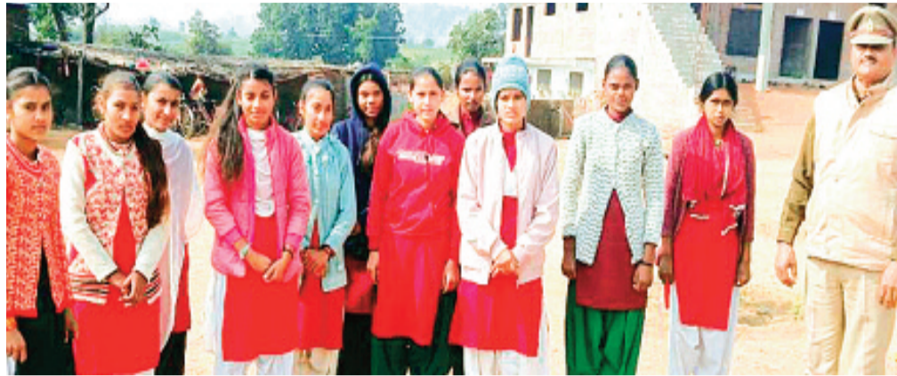
हरिभूमि न्यूज़ ललितपुर