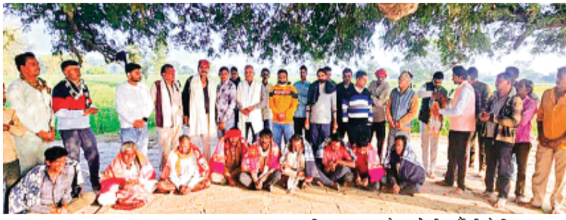
हरिभूमि न्यूज़ ललितपुर

वकील केवल न्यायालय के भीतर ही नहीं, बल्कि समाज के बीच रहकर भी राष्ट्र निर्माण और सेवा का कार्य करता है। इसी भावना के साथ अधिवक्ताओं के एक समूह ने श्रीश्री 1008 शिव मंदिर दुनातर धाम, चंदवली व ग्राम मरौली पर एक प्रेरणादायक पहल की। भीषण शीतलहर को देखते हुए यहां आसपास के क्षेत्रों के असहाय आदिवासी परिवारों को गर्म कंबल वितरित किए गए। कार्यक्रम के दौरान अधिवक्ताओं ने स्पष्ट किया कि कानूनी पेशा केवल मुकदमों तक सीमित नहीं है।