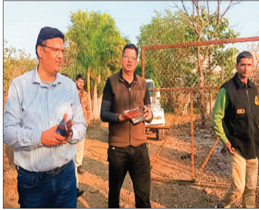
हरिभूमि न्यूज | आगर मालवा

जिले में नशे के कारोबार ने जिस खतरनाक स्तर को छू लिया है, उसका खुलासा शनिवार तड़के केंद्रीय नारकोटिक्स कंट्रोल ब्यूरो की कार्रवाई में हुआ। आमला क्षेत्र स्थित तीर्थ नर्सरी की आड़ में चल रही एमडी ड्रग्स की अवैध फैक्ट्री पर नारकोटिक्स ने सुबह करीब 4 बजे दबिश देकर 10 करोड़ से अधिक की करीब 31 किलो 250 ग्राम एमडी ड्रग्स जब्त की है। यह कार्रवाई जिले में अवैध मादक पदार्थों के खिलाफ अब तक की सबसे बड़ी कार्रवाई मानी जा रही है।