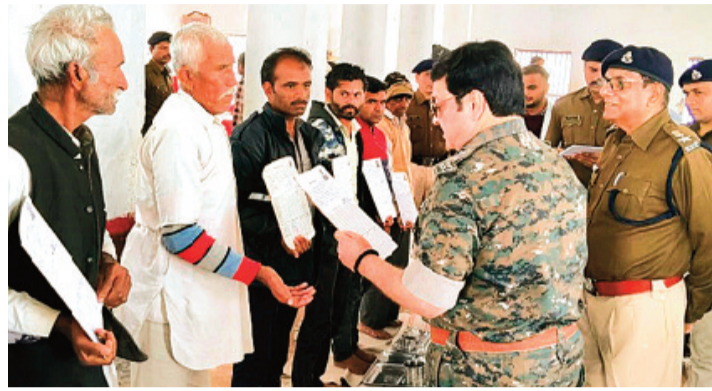
हरिभूमि न्यूज़ | राजगढ़