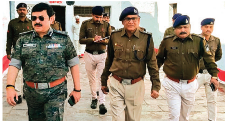
हरिभूमि न्यूज़ | राजगढ़

जेल में बंदियों को दी जा रही सुविधाओं, स्वास्थ्य इत्यादि के संबंध में प्राप्त की जानकारी